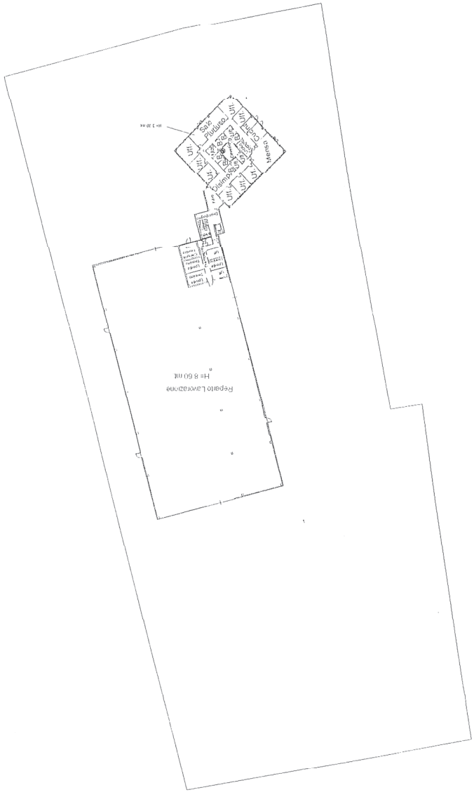
Planta Piano Terra